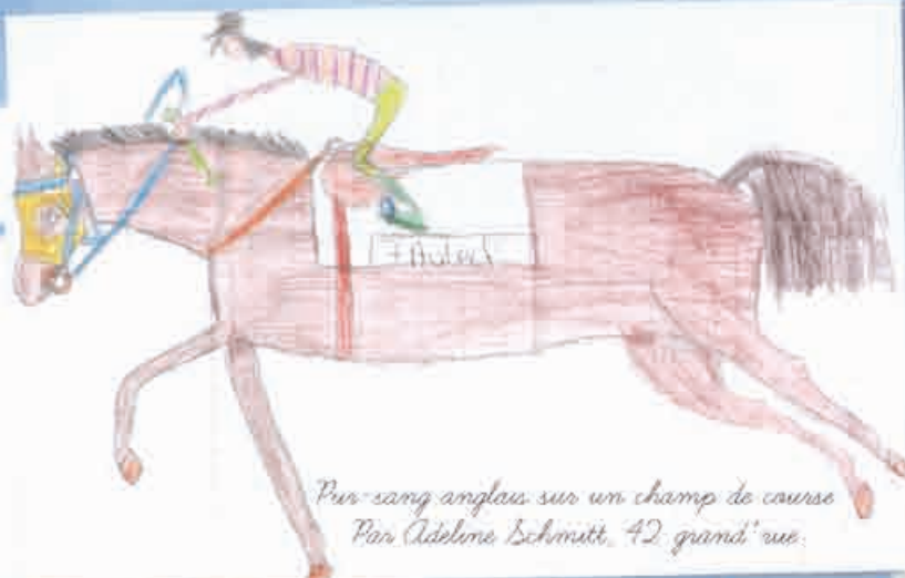
Pur-sang anglais sur un champ de course Par Adeline Schmitt, 42, grand' rue.