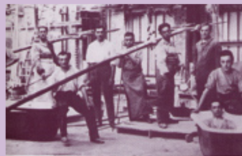
Usine en 1930 : Fonderie, les baignoires De Dietrich