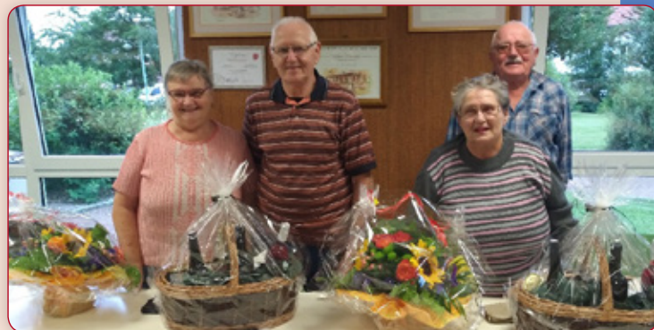
Remerciements de l'Union des Associations